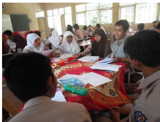
Gambar 2. Dokumentasi tim pengabdian menggambarkan diskusi antara mentor dan tutor dalam FGD dimana siswa aktif dalam bertanya, mengemukakan pendapat dan membuat kesimpulan tentang kasus seputar kesehatan reproduksi

Selain hal tersebut diatas, indikator lain yang dipakai untuk mengukur keberhasilan kegiatan ini adalah dari partisipasi aktif peserta pelatihan, dan kemampuan peserta dalam membuat simpulan FGD. Hasil kegiatan menunjukkan peserta juga aktif bertanya seputar kesehatan reproduksi baik permasalahan higiene dan penyakit reproduksi, pubertas, menstruasi dan fertilitas, aborsi dan kontrasepsi, serta berbagai mitos yang menarik namun menyesatkan mengenai kesehatan reproduksi yang beredar di lingkungan sekolah sehingga perlu untuk diluruskan.