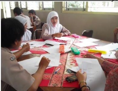
Gambar 1. Dokumentasi tim pengabdian menggambarkan keterampilan siswa tutor sebagai moderator FGD

Selain hal tersebut diatas, indikator lain yang dipakai untuk mengukur keberhasilan kegiatan ini adalah dari partisipasi aktif peserta pelatihan, dan kemampuan peserta dalam membuat simpulan FGD. Hasil kegiatan menunjukkan peserta juga aktif bertanya seputar kesehatan reproduksi baik permasalahan higiene dan penyakit reproduksi, pubertas, menstruasi dan fertilitas, aborsi dan kontrasepsi, serta berbagai mitos yang menarik namun menyesatkan mengenai kesehatan reproduksi yang beredar di lingkungan sekolah sehingga perlu untuk diluruskan.